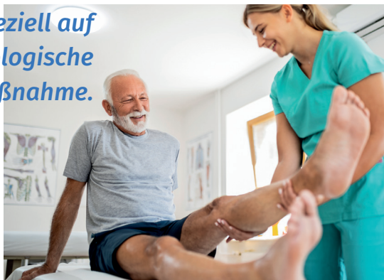
Agenturfoto. Mit Model gestellt.

Spätestens zwei Wochen nach der Behandlung folgt die Anschlussheilbehandlung: eine speziell auf dich abgestimmte onkologische Rehamaßnahme.