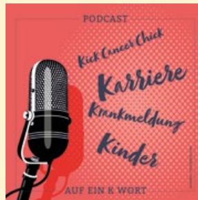
Folge #8 | Auf ein K Wort mit Ulla Ohlms